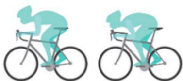
Image 2: Forbidden position only in draft legal races: