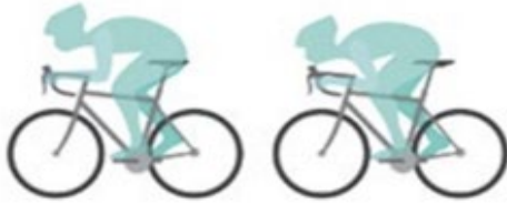
Image 2: Allowed position only in draft illegal races: