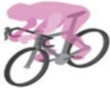
Image 3: Forbidden positions in all races: