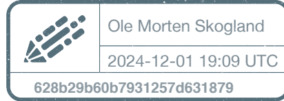
Ole Morten Skogland